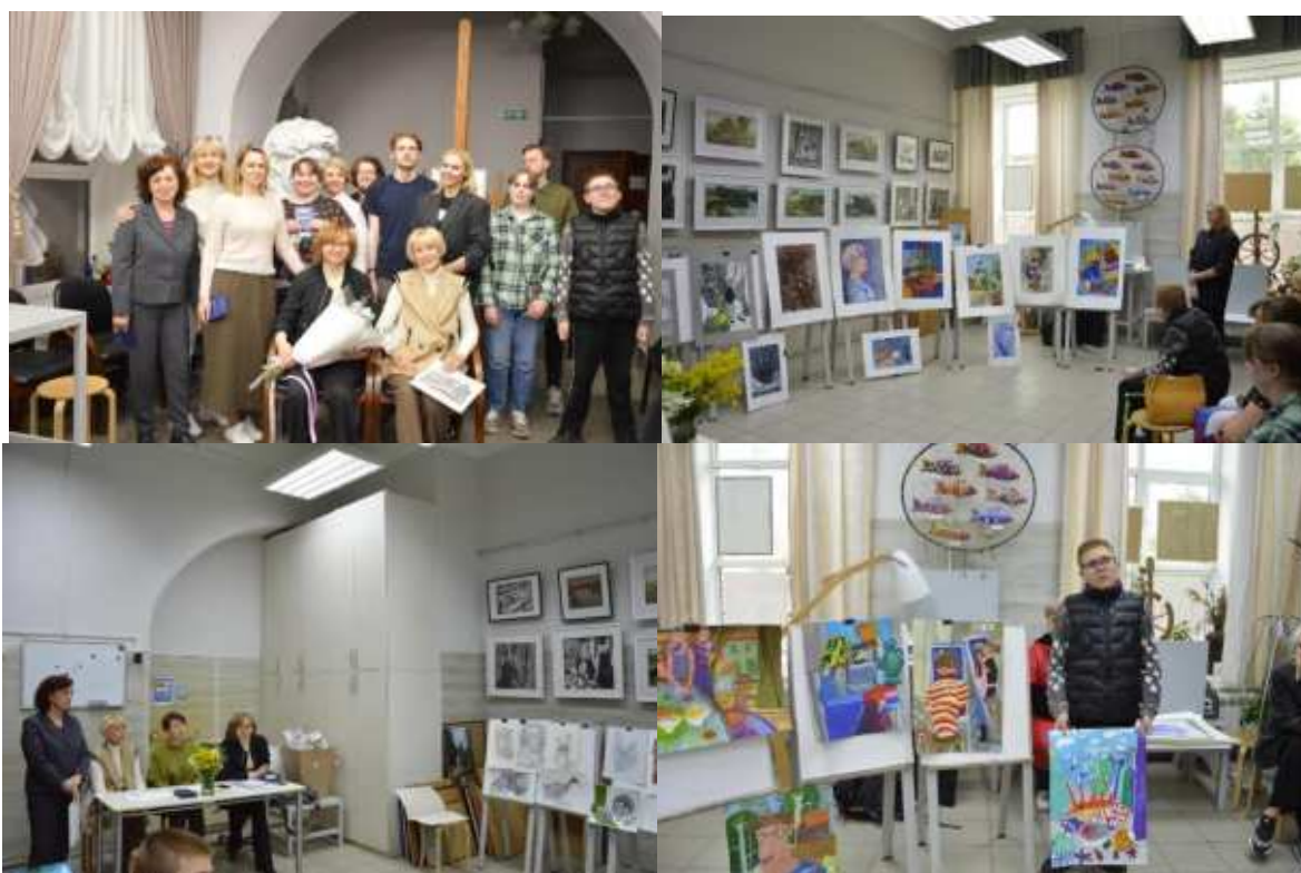
Группа обучающихся структурного подразделения ДХШ №1 приняла участие в проекте "Проориентация юных художников" в г. Москва (июнь 2024 г, г. Москва).