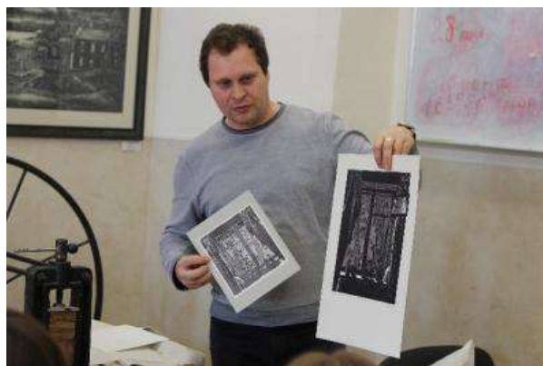
Организация мастер-классов на День победы, Ново-Соборная, 9 мая