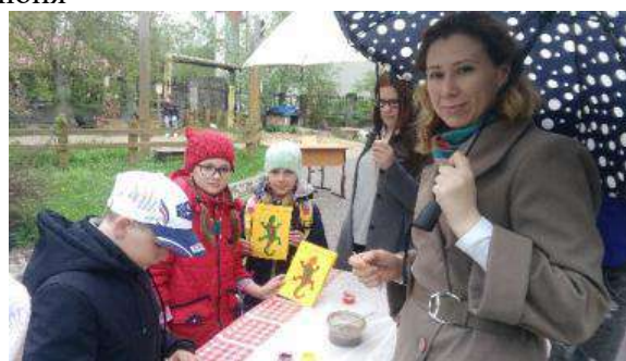
Мастер-классы на День города 2018, 7 июня, пл. Ново-Соборная