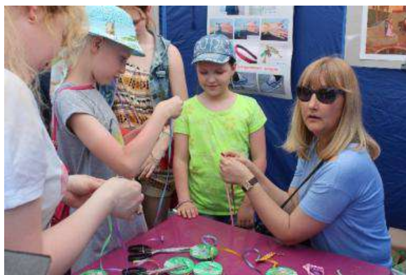
Выездные пленэры в музей Цесаревича Николая, с. Семилужки, июнь