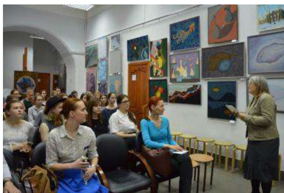
Подведение итогов Томской областной олимпиады по пленэру для учащихся высших и средне-специальных образовательных учреждений художественной направленности, а также для учащихся муниципальных художественных школ и школ искусств города Томск, ТГУ, 23 мая