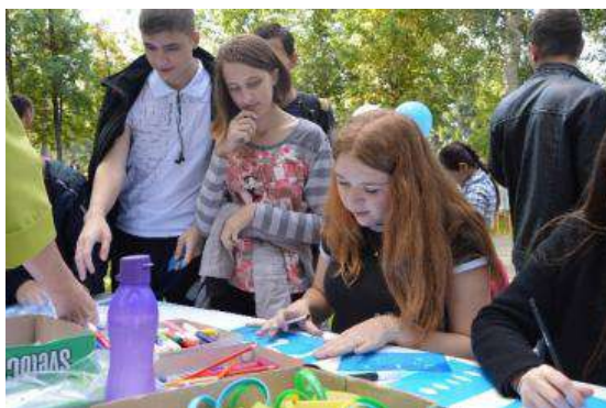
Открытие выставки пленэрных работ «Летний пленэр», Дом ученых, 12 сентября